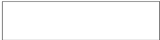
Схема границы эксплуатационной ответственности

Организация водопроводно- канализационного хозяйства